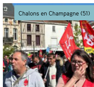
Chalons en Champagne (51)