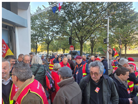
Rassemblement devant l'AGIRC ARRCO à Paris