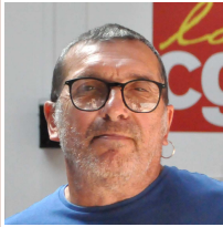
Membre du bureau de l'UFR